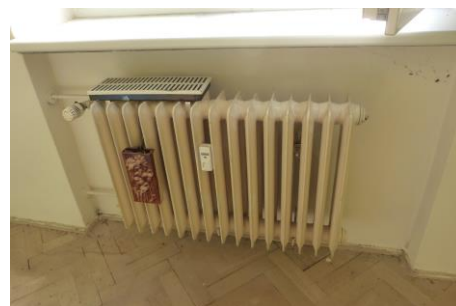
Litínové otopné těleso